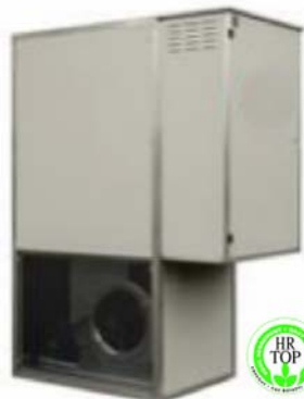
BUITENOPSTELLING X E

VOOR OPBLAASBARE STRUCTUREN 115 > 570 kW