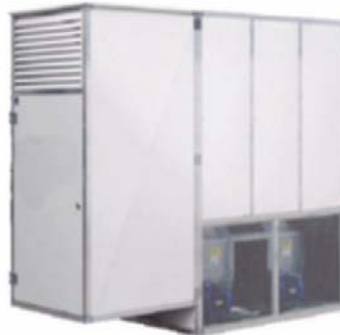
BUITENOPSTELLING SES E

VOOR OPBLAASBARE STRUCTUREN 115 > 570 kW