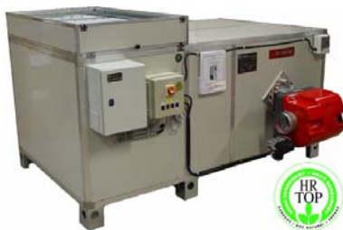
HORIZONTAAL X O