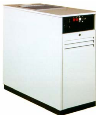
DOMUS - FORNELLA

MOBIEL TOESTEL GROOT VERMOGEN 13 > 29 kW