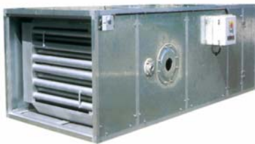
HORIZONTAAL SES H