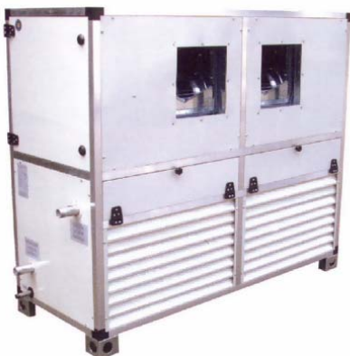
TV - TO